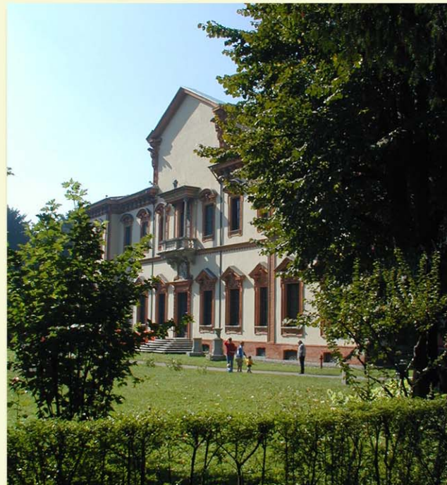
Prospetto di Villa Ghirlanda verso il giardino