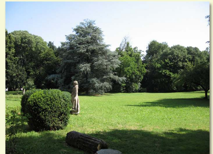
Viste del giardino